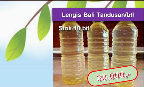
Lengis Bali Tandusan/btl